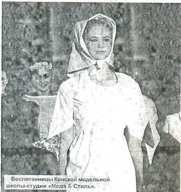
Воспитанницы Канской модельной школы-студии «Мода & Стиль».