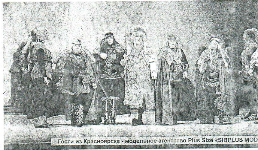
Гости из Красноярска - модельное агентство Plus Size «SIBPLUS MOD»

«Хотя главной темой фестиваля является презентация Сибири как культурного феномена, нашлось здесь место и современному искусству, которое тоже имеет свой местный колорит. Конечно, многое в эти дни было посвящено моде: конкурс красоты, дизайн одежды. Куда же без театра - «Театра мод»? Мероприятия охватили также инструментальное исполнение, вокал, танец и декоративно-прикладное искусство.»