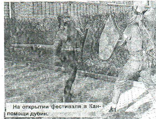
На открытии фестиваля в Канске - помощи дубин.